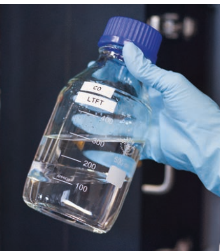
FT-Rohprodukt mit sichtbarer wässriger und ölig Phase.